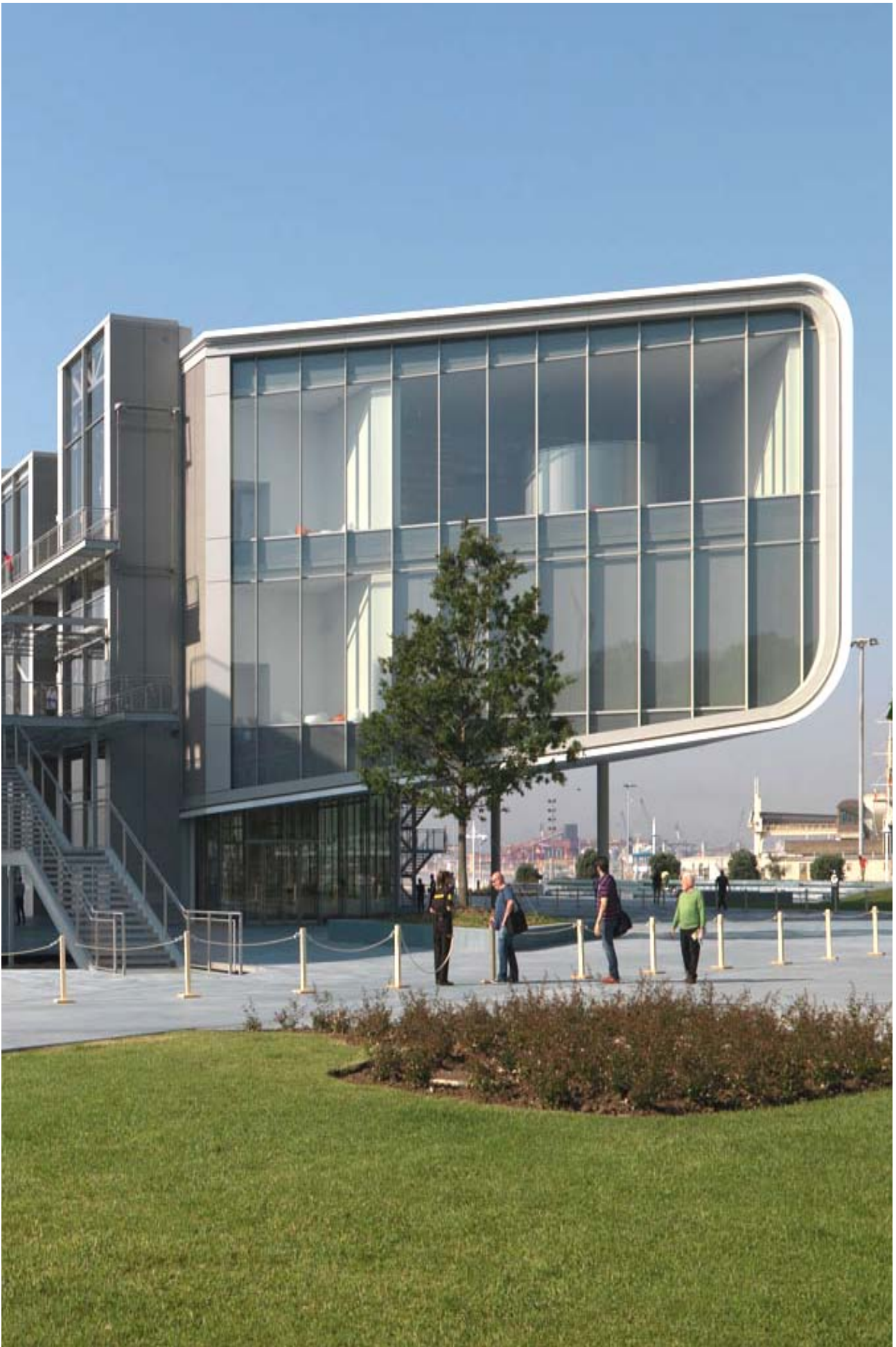
Renzo Piano (2017). Centro Botín . (Detalle). Santander.