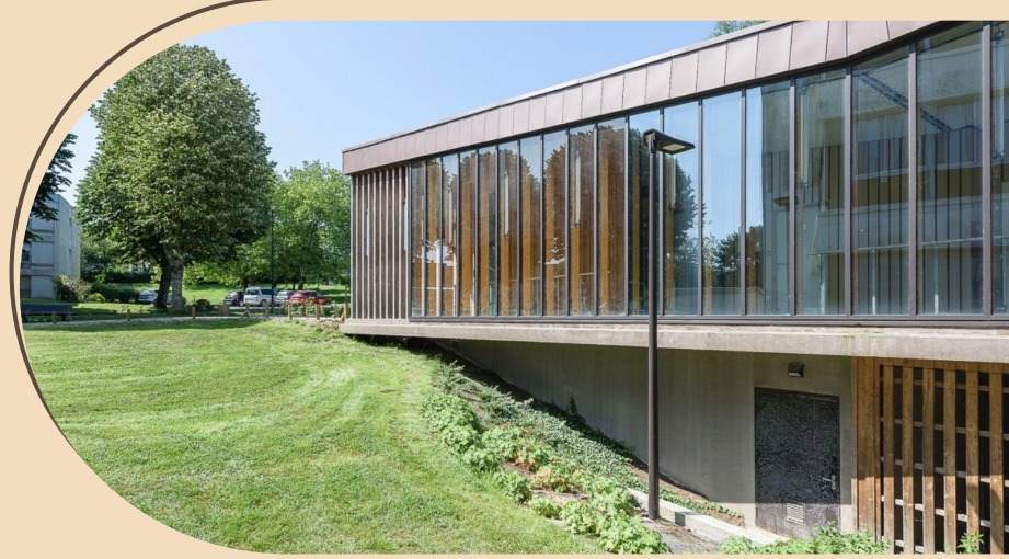
Lycée Amiral Ronarc'h