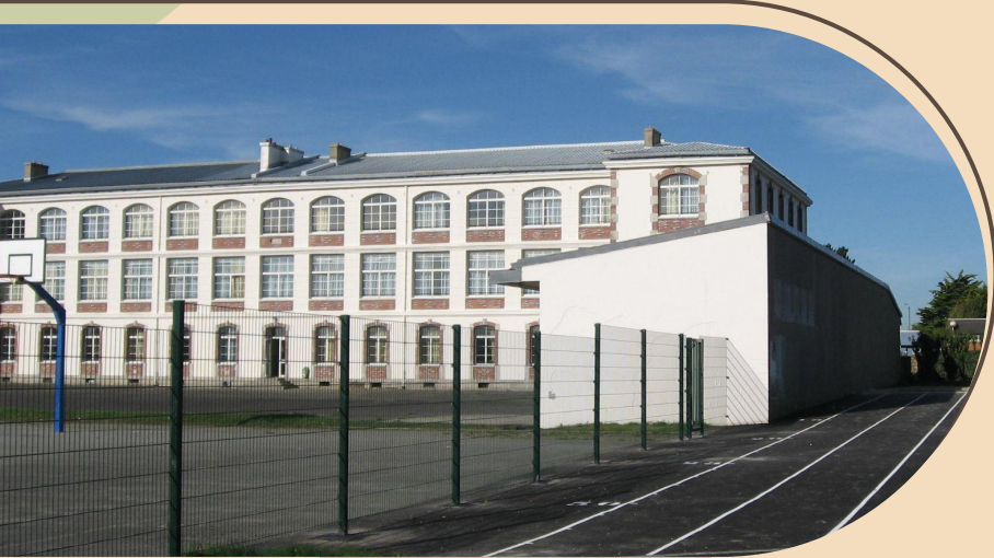
Collège Les Quatre Moulins