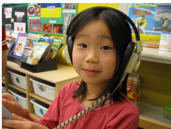
Alumna en el centro de lectura independiente de audio libros.