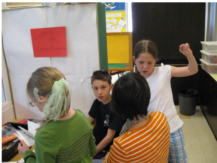
La lengua de trabajo es el español.