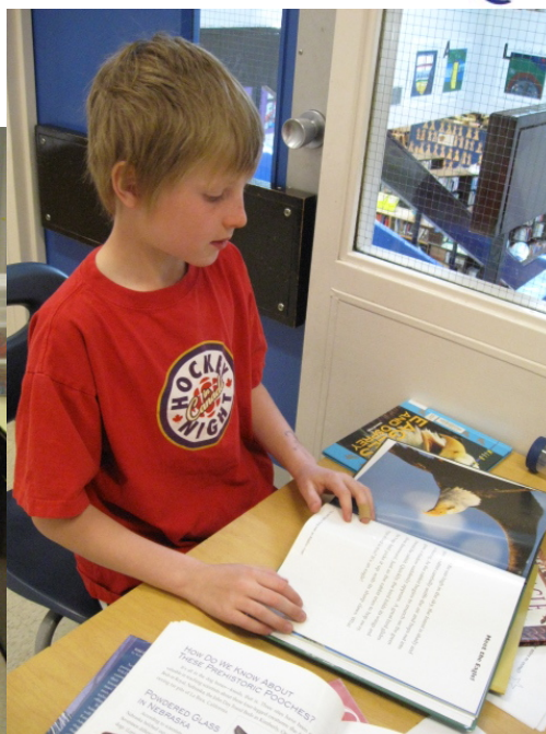
Buscando información para el póster.