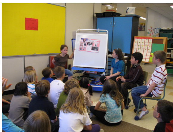
Exposición oral del trabajo de investigación.