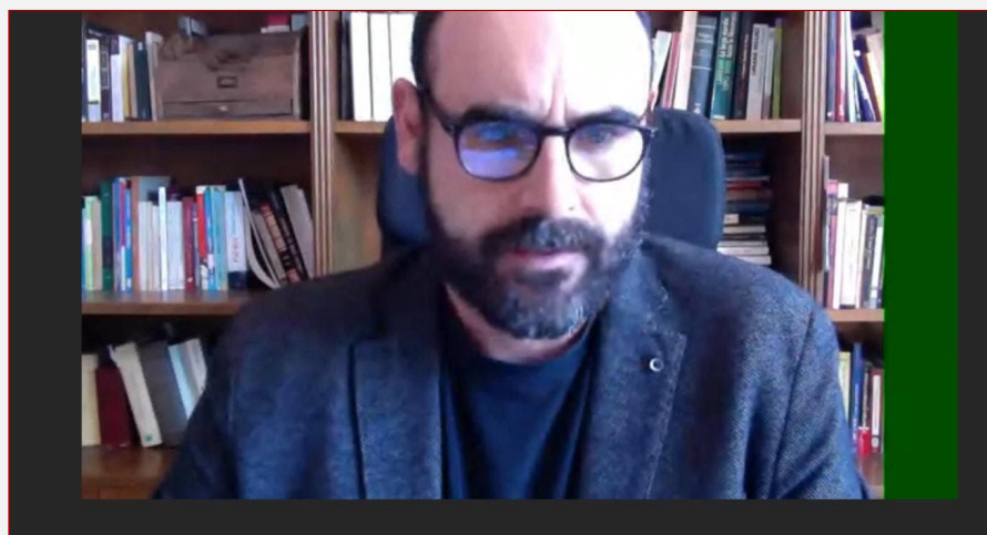
Ponente del taller Manual de urgencia: adaptación de la clase ELE a la videoconferencia en la primera sesión del curso de actualización en línea ELE

La iniciativa continúa así, durante el período de confinamiento debido a la COVID-19, la oferta de formación que la Consejería viene haciendo al profesorado francés de español en los últimos años en colaboración con otros organismos públicos.