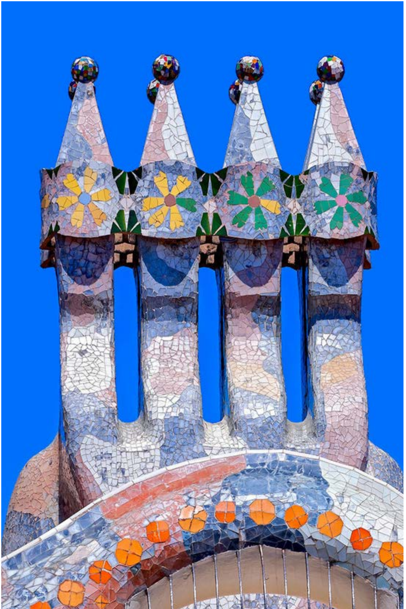
Antoni Gaudí i Cornet. Casa Batlló, 1904-1906 (Barcelona). (Detalle).