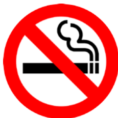
2; Imagen figurativa - icónica

Como se explicó anteriormente, aunque Goldstein (2012: 20) ubica los signos, símbolos e iconos en una categoría funcional propia y diferenciada, en este trabajo se propone que los signos, símbolos e iconos pueden cumplir diversas funciones. Una de ellas sería la propiamente figurativa, ya que en ocasiones representan metafóricamente un concepto abstracto o un referente concreto. En los manuales de español normalmente se utilizan únicamente símbolos convencionalmente aceptados en la sociedad de la LM puesto que se prevé que el alumno encontrará estos símbolos en una hipotética estancia en dicho entorno. Así, suelen recogerse señales de tráfico, leyendas utilizadas en mapas y planos de transporte público, símbolos que identifican edificios públicos o de interés turístico, etc. Su funcionalidad es similar a la de las imágenes figurativas y suelen utilizarse como facilitadores de adquisición de vocabulario.