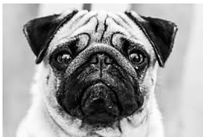
1; Imagen figurativa de "perro"

Puede afirmarse que las imágenes figurativas hacen auténticas traducciones de las palabras que acompañan. La diferencia es que no traducen las palabras a la LM del alumno, sino que las traducen al lenguaje visual. Esto no sólo favorece la comprensión de la palabra y el establecimiento de mecanismos asociativos que permitan la memorización de las palabras, sino que mejora la accesibilidad del conocimiento adquirido al evitar recurrir a la traducción literal en la lengua materna del alumno (Barrallo y Gómez 2009: 3).