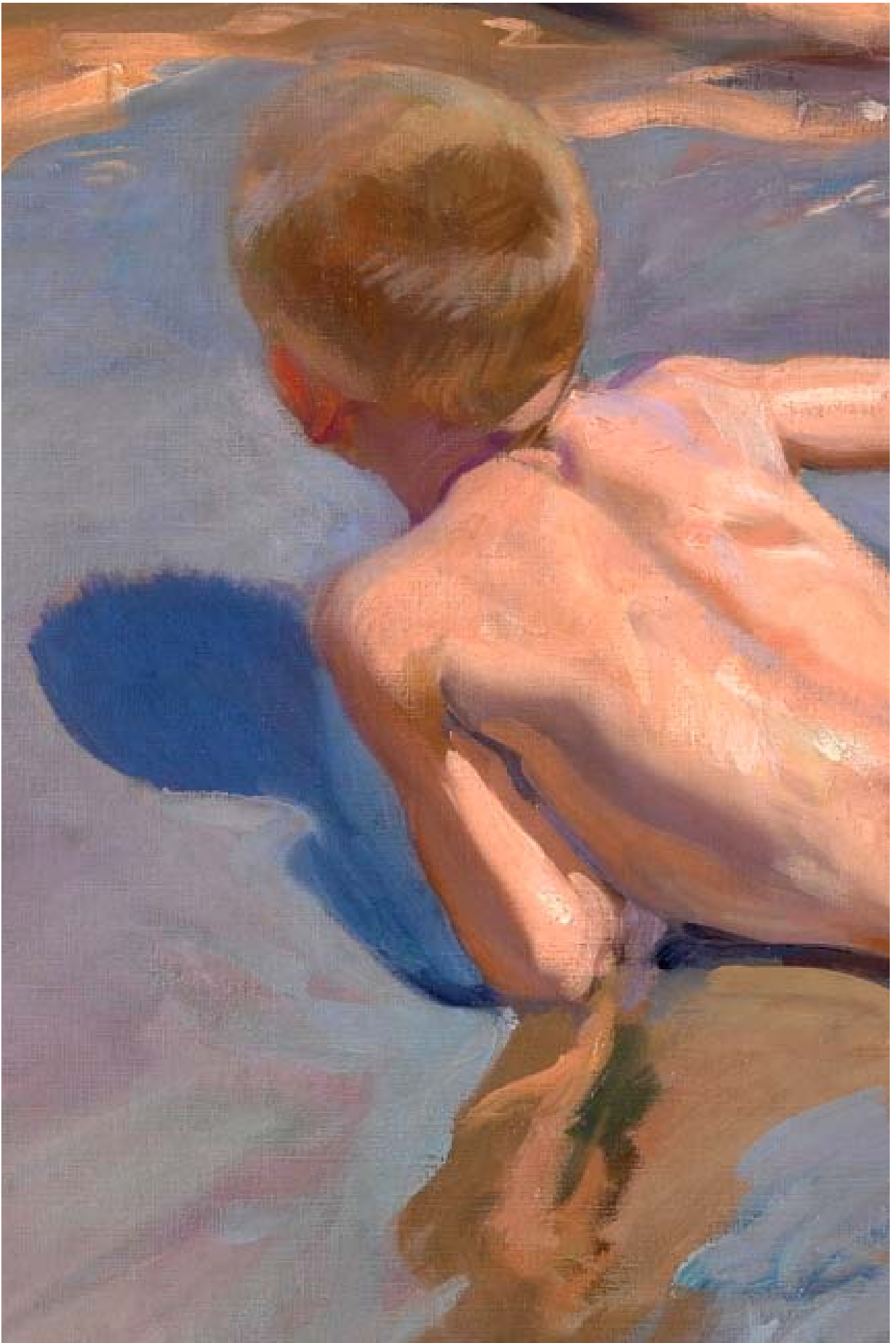
Sorolla y Bastida, J. (1909). Chicos en la Playa. (Detalle). Madrid: Museo Nacional del Prado.