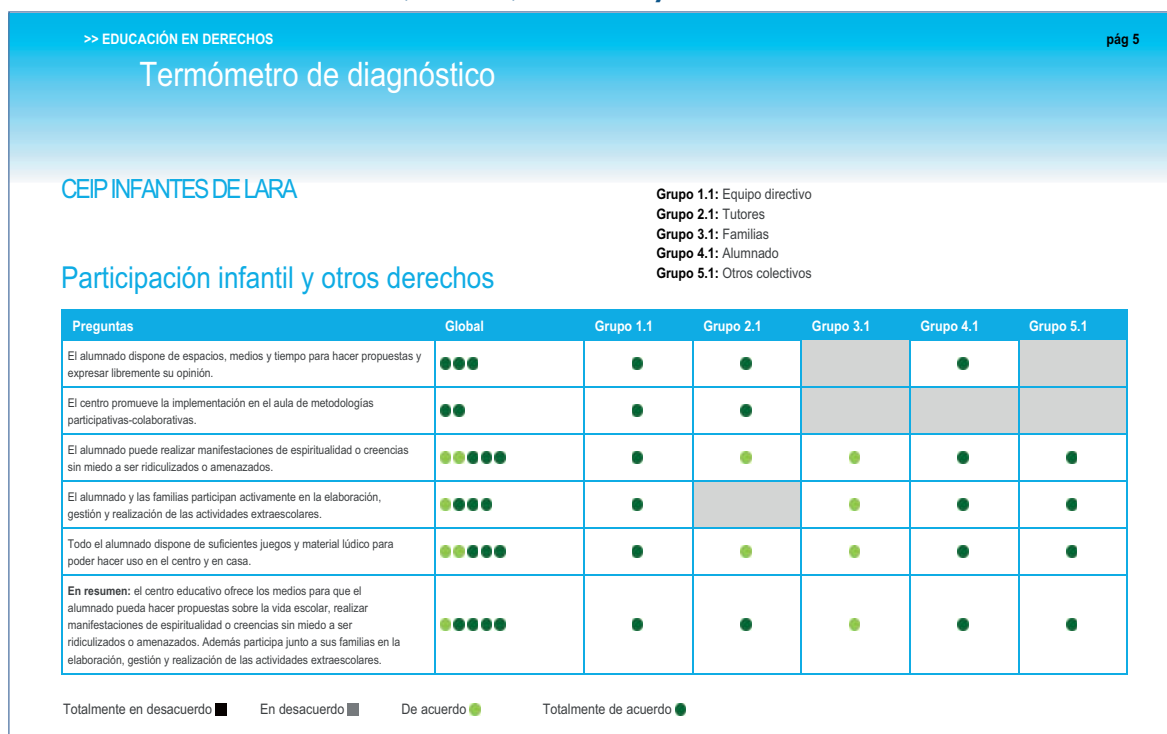
Figura 3 Valoración de la participación infantil y otros derechos por los diferentes grupos: equipo directivo, tutores, familias, alumnado y otros colectivos