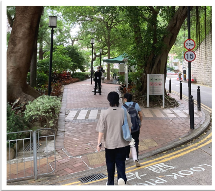
Continuamos caminando por aquí en dirección hacia el Main Building