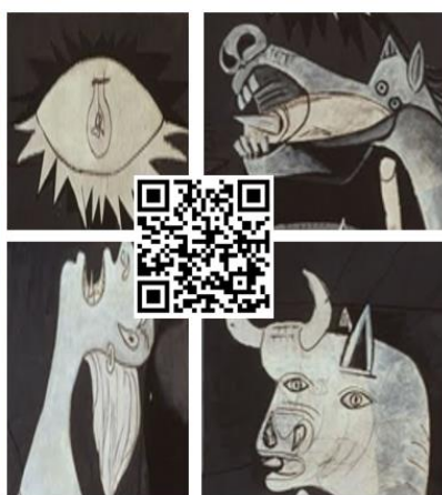
Guernica, Picasso (1937)