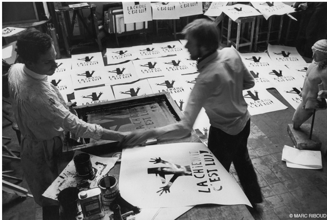
Atelier de sérigraphie de l'Ecole des beaux-arts, rebaptisé atelier populaire. Photo Marc Riboud, mai 68, Paris.

Document 2 : Le 14 mai 1968, le comité de grève de l'École des beaux-arts collabore avec la réalisation d'affiches.