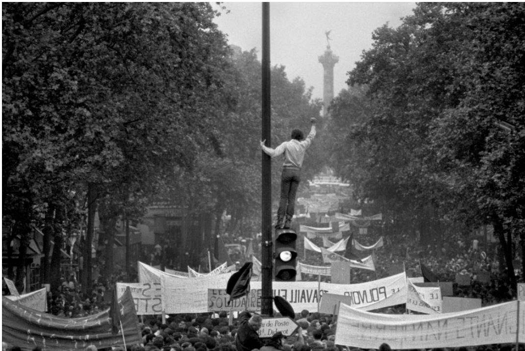
Manifestation dans le 11 e arrondissement, 1968, Paris, France.

Document 1 : Le 13 mai 68, une immense manifestation ouvrière et étudiante traverse Paris.