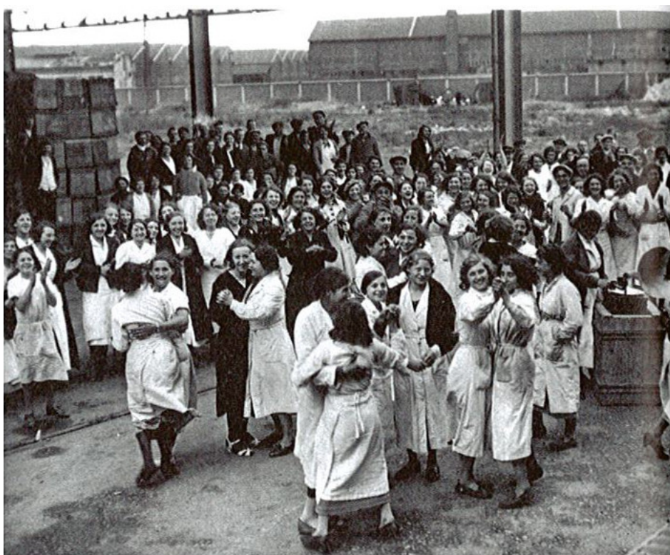
Grève joyeuse. Ouvrières de l'usine de biscuits Huntley & Palmers à la Courneuve en juin 1936. https://hgcaeschau.wordpress.com , 2016.