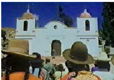
PLAZA PRINCIPAL DEL PUEBLO. EN EL DEPARTAMENTO DE AYACUCHO UNA DE LAS ZONAS MÁS CASTIGADAS POR EL TERRORISMO