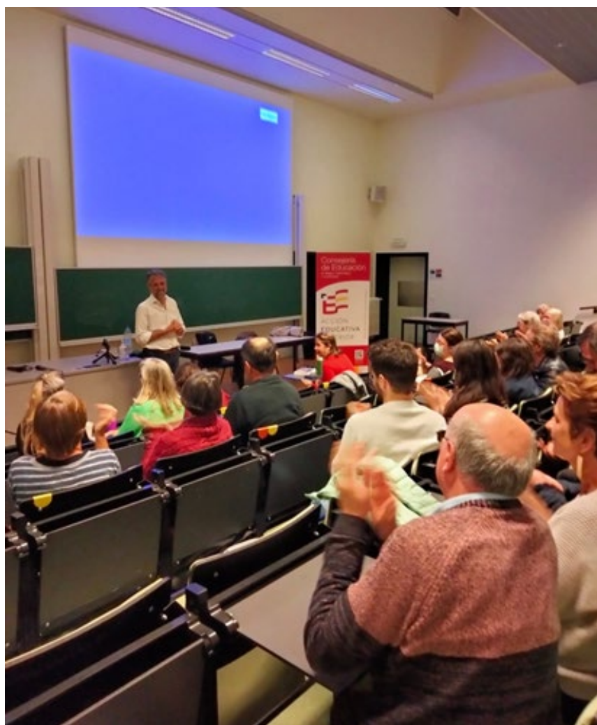
Activiteit Spaans in het CVO Semper-Leuven

Het Spaans kent een zeer sterke ontwikkeling buiten het gereguleerde onderwijssysteem, in het volwassenenonderwijs of Onderwijs voor sociale promotie, een vorm van onderwijs waar in België veel vraag naar is en die door de samenleving als zeer belangrijk wordt beschouwd. Het cursusaanbod omvat modulaire cursussen moderne talen, waaronder Spaans, georganiseerd in niveaus van variabele duur. In tegenstelling tot formeel onderwijs valt Spaans op als een van de eerste talen die in Vlaanderen in centra voor volwassenenonderwijs worden gestudeerd.