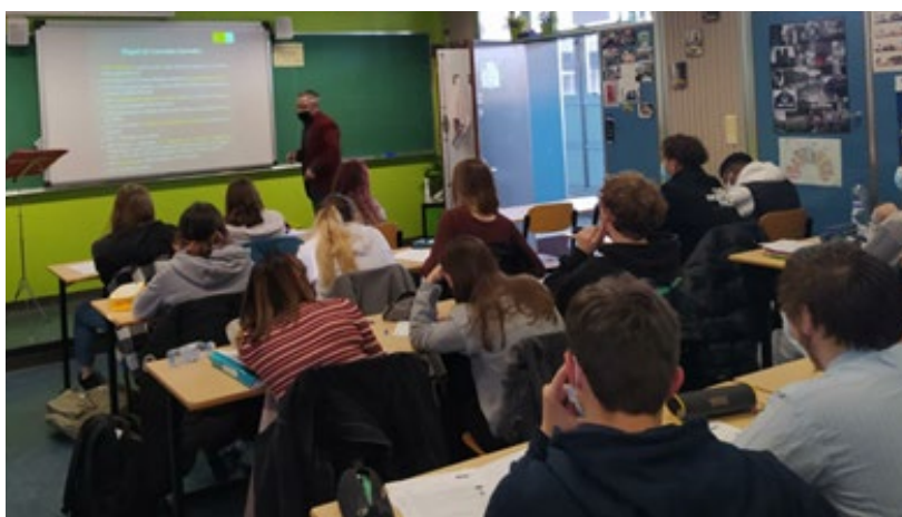
Activiteit in het Spaans in een secundaire school