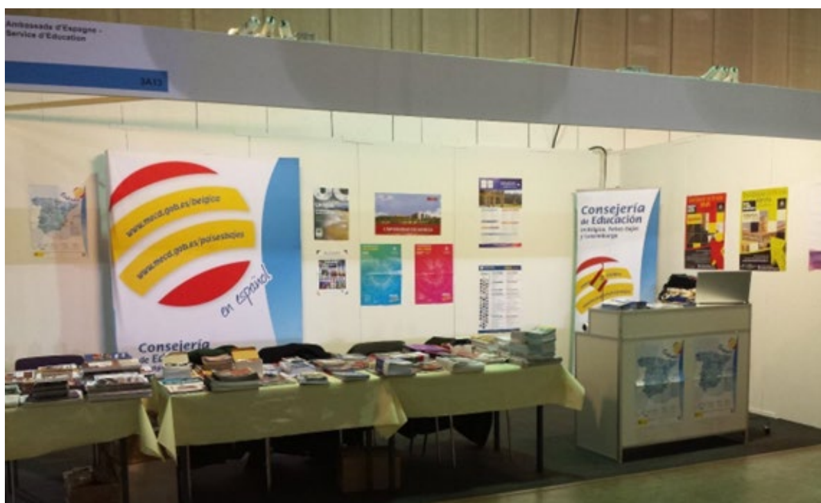
Stand de l'Office d'Éducation à la Foire de l'Étudiant du Luxembourg