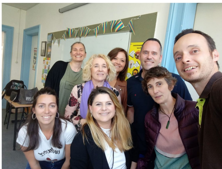
Docententeam ALCE Nederland 2022