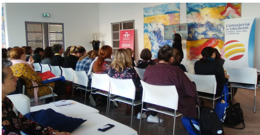
Studiedag Departement van Onderwijs – Instituto Cervantes

Het Departement werkt ook nauw samen met het Instituto Cervantes door het jaarlijks organiseren van twee studiedagen waarvoor ervaren docenten uit de omgeving uitgenodigd worden om iets te vertellen over het onderwijs van Spaans als vreemde taal.