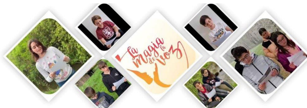
Ragazzi dell'ALCE Svizzera festeggiano la Giornata della lettura ad alta voce

La Consejería de Educación svolge quindi diverse azioni per ottimizzare i rapporti con le istituzioni e gli enti del Paese, rafforzando e mantenendo quelli esistenti. In questa interazione, la comunicazione e la collaborazione con associazioni di insegnanti e studiosi della lingua spagnola in Svizzera sono di grande interesse e utilità. Va qui citata l'Asociación Suiza de Profesores de Español (ASPE), con cui si tengono riunioni periodiche per tastare regolarmente il polso dell'insegnamento dello spagnolo nella scuola secondaria e al liceo (soprattutto per quanto riguarda la posizione dello spagnolo nella riforma del diploma di maturità). Un'attività di successo svolta in collaborazione con ASPE è il "Concorso di cortometraggi in lingua spagnola per tutte le età". A livello di istruzione superiore vanno ricordati la Sociedad Suiza de Estudios Hispánicos (SSEH) e i dipartimenti universitari che tengono viva la fiamma della lingua e della letteratura spagnola negli atenei svizzeri ((soprattutto per quanto riguarda la posizione dello spagnolo nella riforma del diploma di maturità).