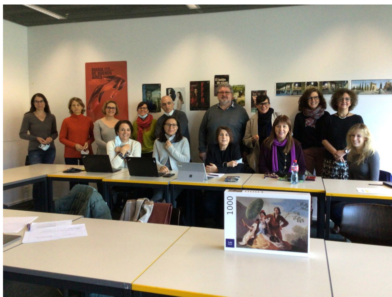
Insegnanti di spagnolo delle scuole del cantone di Berna

La Consejería de Educación svolge quindi diverse azioni per ottimizzare i rapporti con le istituzioni e gli enti del Paese, rafforzando e mantenendo quelli esistenti. In questa interazione, la comunicazione e la collaborazione con associazioni di insegnanti e studiosi della lingua spagnola in Svizzera sono di grande interesse e utilità. Va qui citata l'Asociación Suiza de Profesores de Español (ASPE), con cui si tengono riunioni periodiche per tastare regolarmente il polso dell'insegnamento dello spagnolo nella scuola secondaria e al liceo (soprattutto per quanto riguarda la posizione dello spagnolo nella riforma del diploma di maturità). Un'attività di successo svolta in collaborazione con ASPE è il "Concorso di cortometraggi in lingua spagnola per tutte le età". A livello di istruzione superiore vanno ricordati la Sociedad Suiza de Estudios Hispánicos (SSEH) e i dipartimenti universitari che tengono viva la fiamma della lingua e della letteratura spagnola negli atenei svizzeri ((soprattutto per quanto riguarda la posizione dello spagnolo nella riforma del diploma di maturità).