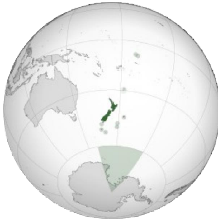
Imagen: Mapa geográfico de Nueva Zelanda de Wikipedia