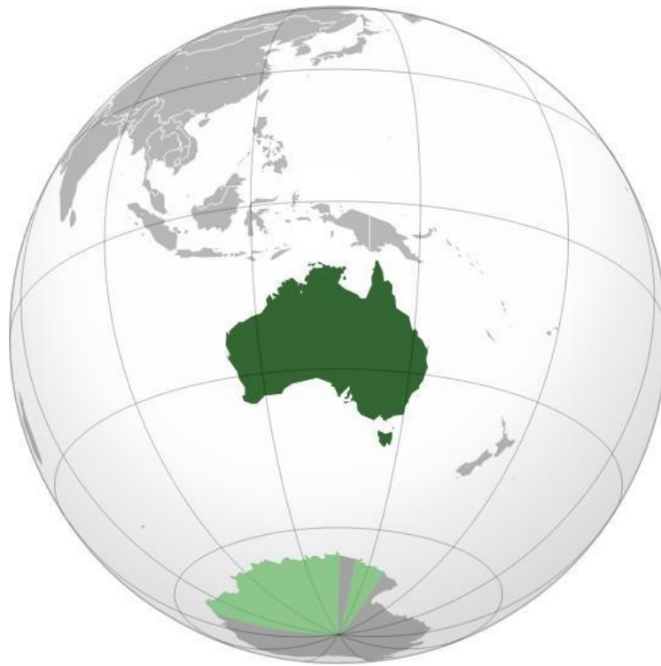
Imagen: Mapa geográfico de Australia de Wikipedia